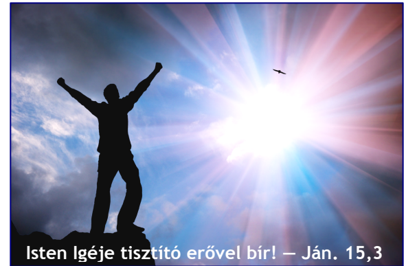
Isten Igéje tisztító erővel bír! – Ján. 15,3

Folytatjuk az előző számunkban indított témát a bűnről . A világ igen elferdült és bűnben leledzik. Viszont ebben a földi világban a szentek fénylenek , mint a csillagok. (Fil. 2,14-15) Ez alatt azok értendők, akik a szívükbe fogadták Jézust, hiszen a mi Bárányunk tiszta, hibátlan. A görögben a tiszta szó jelenti még azt is, hogy vegyítetlen , vagyis a világ szennytől érintetlen . Ha így tűntök fel a világban, akkor valóban csillagként fogtok ragyogni, utat mutatva ezzel másoknak.