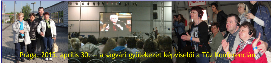
Prága, 2015. április 30. – a ságvári gyülekezet képviselői a Tűz Konferencián

BENNY HINN – Páran részesei lehettünk a Fresh Fire For All Nations (Friss Tűz Minden Nemzetért) három szolgálatának. Benny Hinn ugyan nem tudott személyesen jelen lenni, de este online tanított, amit kivetítőn láthattunk. Isten kegyelmét megtapasztalva tűzzel és örömolajjal telve térhettünk haza, amivel megáldottuk itthoni Testvéreinket.