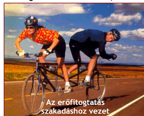
Az erőfitogtatás szakadáshoz vezet

ÉKEK – Egyetlen intelligens férj sem szeretné, hogy a felesége egy édesanya szerepét játssza vele. A feleségem nem az anyám, és én sem vagyok az ő apja. Az emberek olykor összekeverik ezeket a dolgokat, összezavarodnak. Inkább kérdést tegyünk fel ahelyett, hogy követelőznénk. Teljesen más megvilágításba helyezi a dolgokat, ha kérdést teszünk fel ahelyett, hogy kijelentenenénk: márpedig ez így lesz! Nem! Végy le a hangerőből, fogd vissza az indulataidat. Inkább tegyél fel egy kérdést, kezdemenyezz egy beszélgetést , ahelyett, hogy erőltetnél valamit. Hogyan kerülnek be az ékek? Valaki beerölteti azokat. Hogyan kerül az ék a fahasádba aprításakor? Valakinek be kell vernie, hogy széthasadjon. Egy külső erő kell hozzá. Ha senki nem erőlteti, senki nem nyomja az éket, akkor nem kerül oda soha, és a tűzifa kugli nem szakad részekre. Átvitt értelemben pedig, ha nincs ék , nem jön létre az elkülönülés . – Forrás: Keith Moore