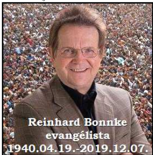
Reinhard Bonnke evangélista