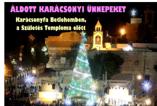
ÁLDOTT KARÁCSONYI ÜNNEPEKET

ADVENT – A karácsonyt megelőzi a négyhetes advent (Úrjövét), ennek első vasárnapjával kezdődik az egyházi év. A karácsony a megígért Megváltó eljövetele, Isten testet öltése Jézus személyében. A Szentírásban ugyan nem szerepel a karácsony szó, de maga az esemény, amit a keresztény világ ilyenkor ünnepele, az nagyon részletesen le van írva. A Máté és a Lukács evangéliuma is hosszan tárgyalja ezt az eseménysort, de a János evangélium eleje is erről szól. Nem véletlen hát, hogy a keresztény világ évszázadok óta megemlékezik erről az eseményről. A Messiás megszületésének megünneplése méltó az újjászületett hívők körében.